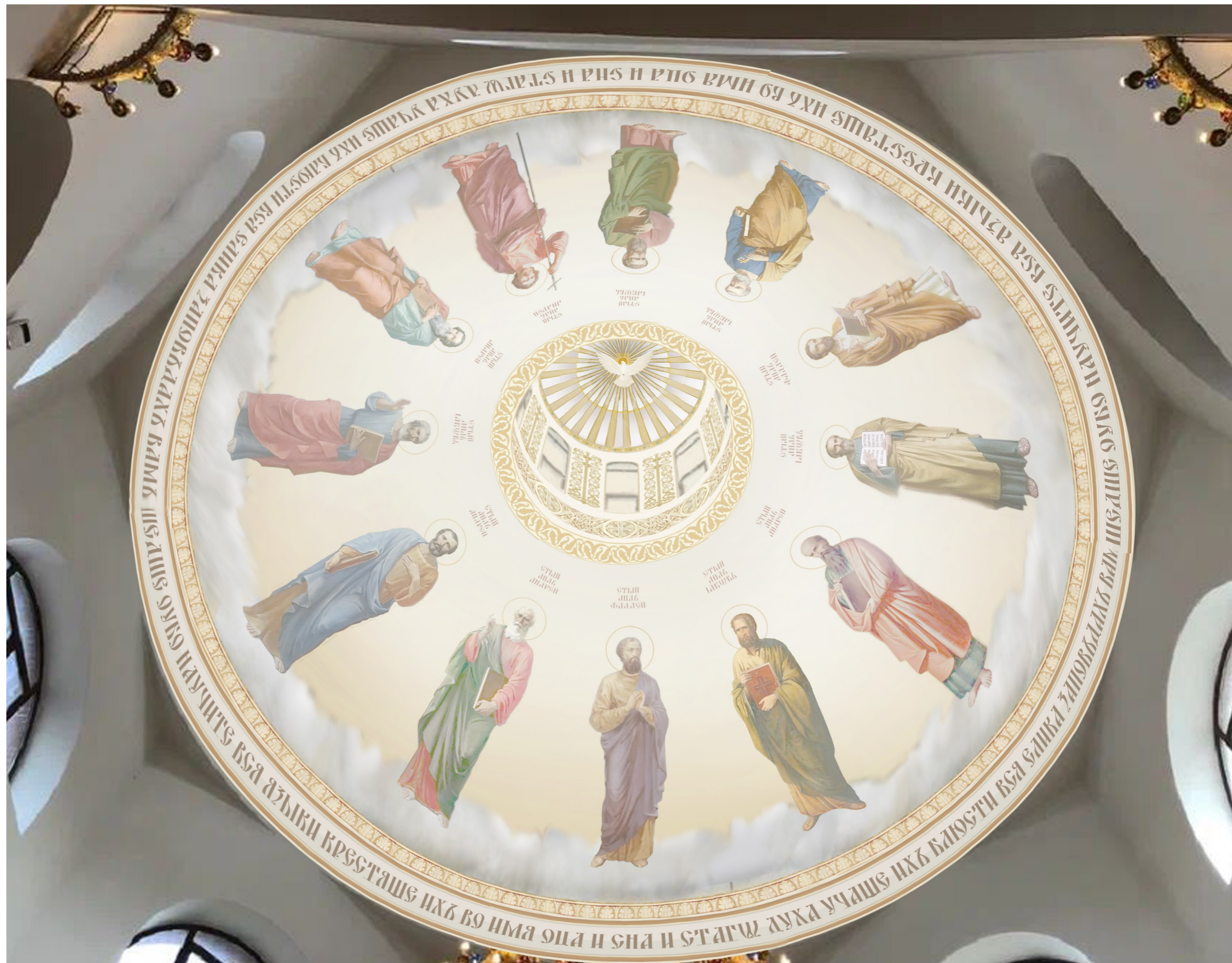
Общий вид купольной части